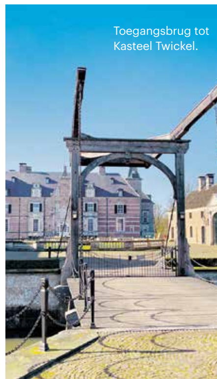
Toegangsbrug tot Kasteel Twickel.

Enigszins bittere sinaasappels komen er uit de oranjerie. Andere groenten en fruit komen uit de enorme, ommuurde moestuin. Toen en nu. De laatste barones at uitsluitend uit eigen tuin. Na haar overlijden raakte die tuin in verval, er gingen stemmen op om er een parkeerplaats van te maken voor bezoekers, maar Stichting Twickel besloot de tuin in ere te herstellen. In de oud-Engelse anjerkas werden de anjers gekweekt die baron Van Heeckeren dagelijks op zijn revers droeg, nu kweekt men er de bloemen die staan in de siertuinen rond het kasteel.