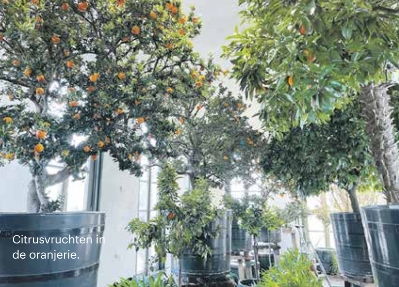
Citrusvruchten in de oranjerie.