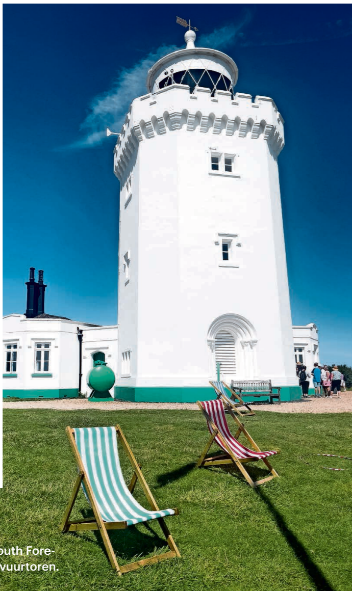
De South Foreland-vuurtoren.

Dit is mijn favoriete plek op de wereld'