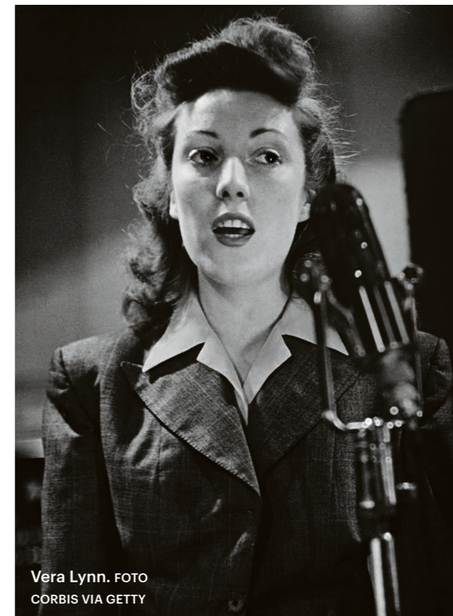
Vera Lynn.

De kliffen zelf zijn gevormd uit planten- en dierenresten uit zee, tijdens verschillende periodes in het Krijt (65 tot 140 miljoen jaar geleden). Het krijtgrasland erbovenop, waar de wandeling dwars doorheen gaat, is een ideale omgeving voor wilde bloemen, vlinders en vogels – met zeldzame vlindersoorten als het adonisblauwtje en beschermde orchideeën. Het gebied is ook kwetsbaar; door erosie brokkelen de krijtrotsen af.