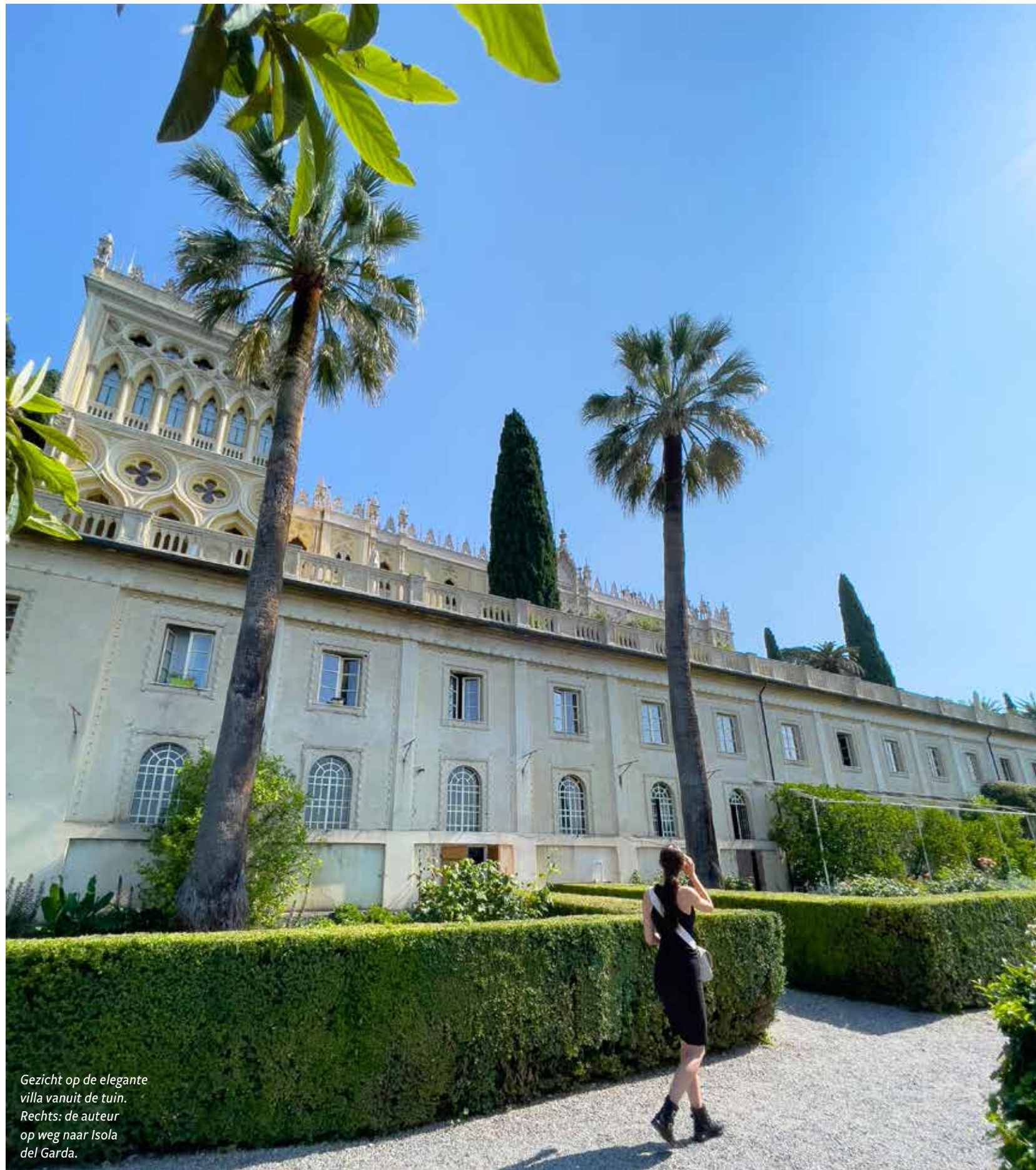
Gezicht op de elegante villa vanuit de tuin. Rechts: de auteur op weg naar Isola del Garda.