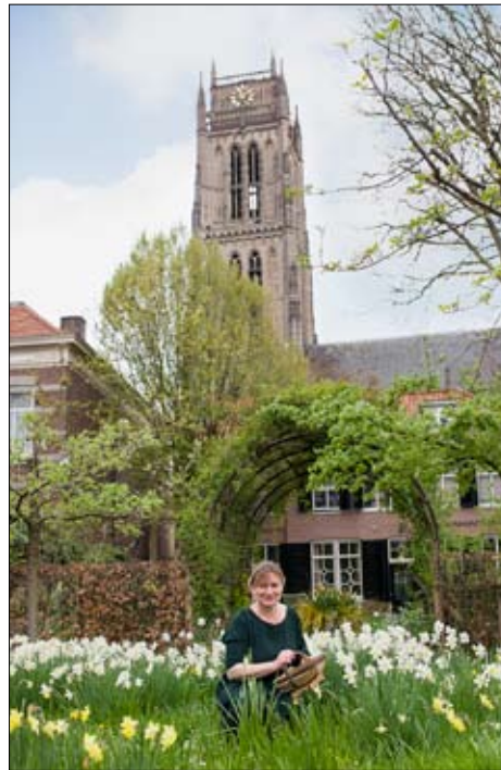
Naarden-Vesting, Zaltbommel en Amerongen