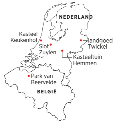
Kasteeltuin Hemmen: kleurrijk en speels.