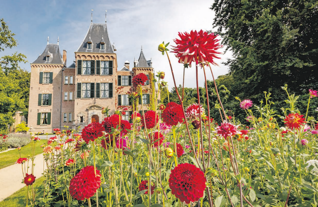
In de tuin van Kasteel Keukenhof bloeien 's zomers de mooiste dahlia's.