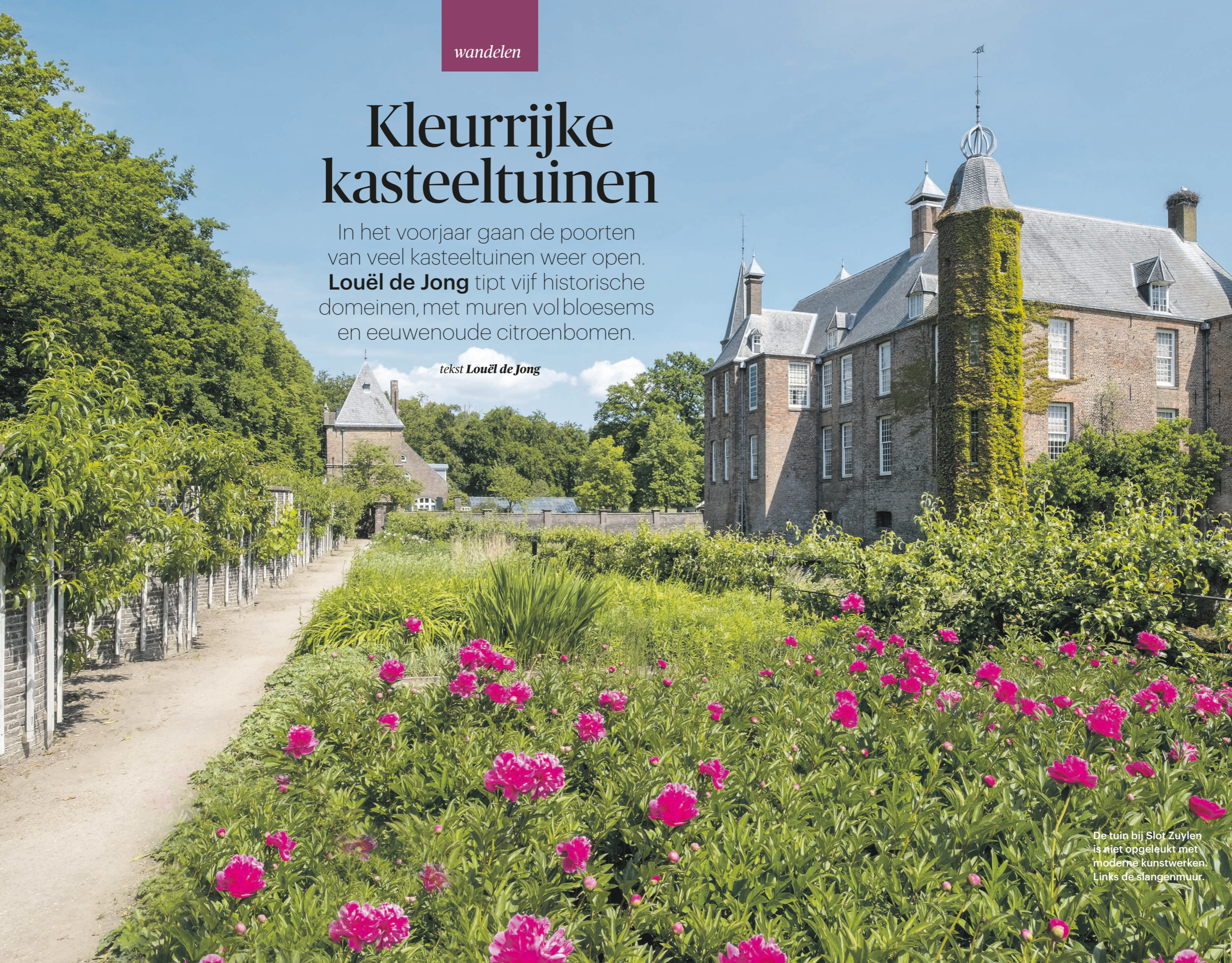
De tuin bij Slot Zuylen is niet opgeleukt met moderne kunstwerken. Links de slangenmuur.